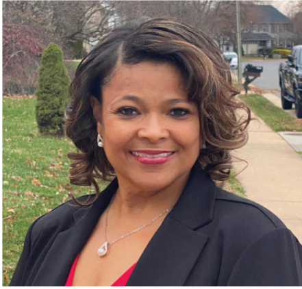
Alcaldesa Michelle Davis-Younger

Abril ha llegado y todos estaremos felices de dar la bienvenida de regreso al Mercado de Agricultores, los paseos de Anda con la Alcadesa [Mayor on the Move], la continuación de nuestros eventos famosos del Primer Viernes [First Fridays] y, claro, más festivales y oportunidades para comer al aire libre. También es el mes de enfocarnos en nuestros parques y espacios naturales.