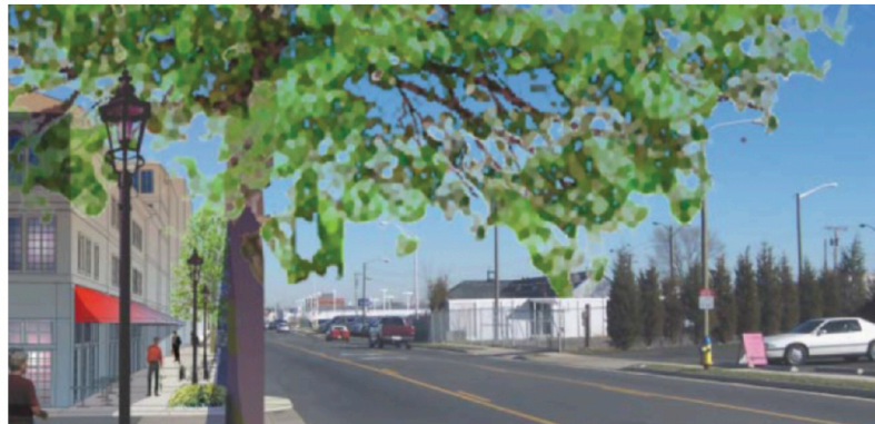
una imagen del Plan para el Sector de la Avenida Mathis del 2006

La Plaza Comercial de Manassas, construida en 1959, tiene más de 100,000 pies cuadrados (aprox. 9,290 metros cuadrados) de espacio en el edificio y 13.5 acres de tierra. El precio de $16 millones será pagado usando fondos únicos de la Ley del Plan de Rescate Estadounidense (ARPA, por sus siglas en inglés) y fondos de capital de reserva, y se incluye en el presupuesto para el año fiscal (FY) 2025